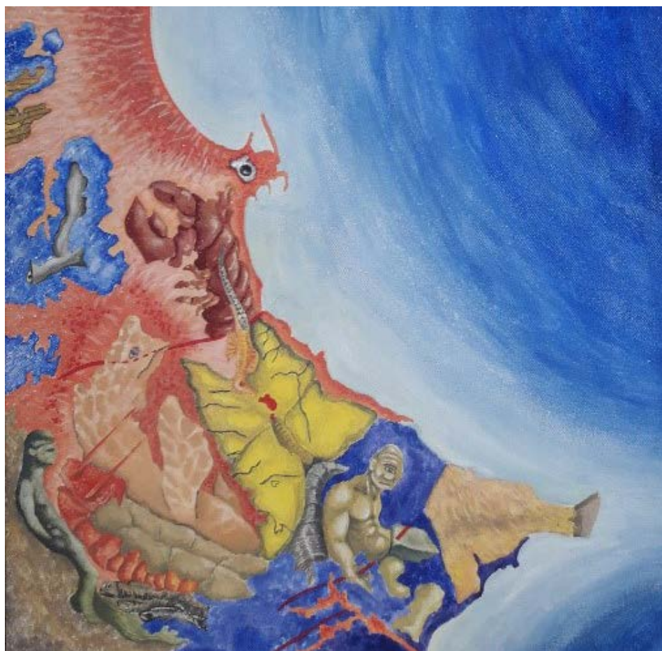
Mapa geo-sofica di Crotona

Evento organizzato nell'ambito della "Giornata Nazionale del Paesaggio" del 14/03/2022 (Verrà effettuato domenica 13/03/2022 per agevolare la partecipazione all'iniziativa)